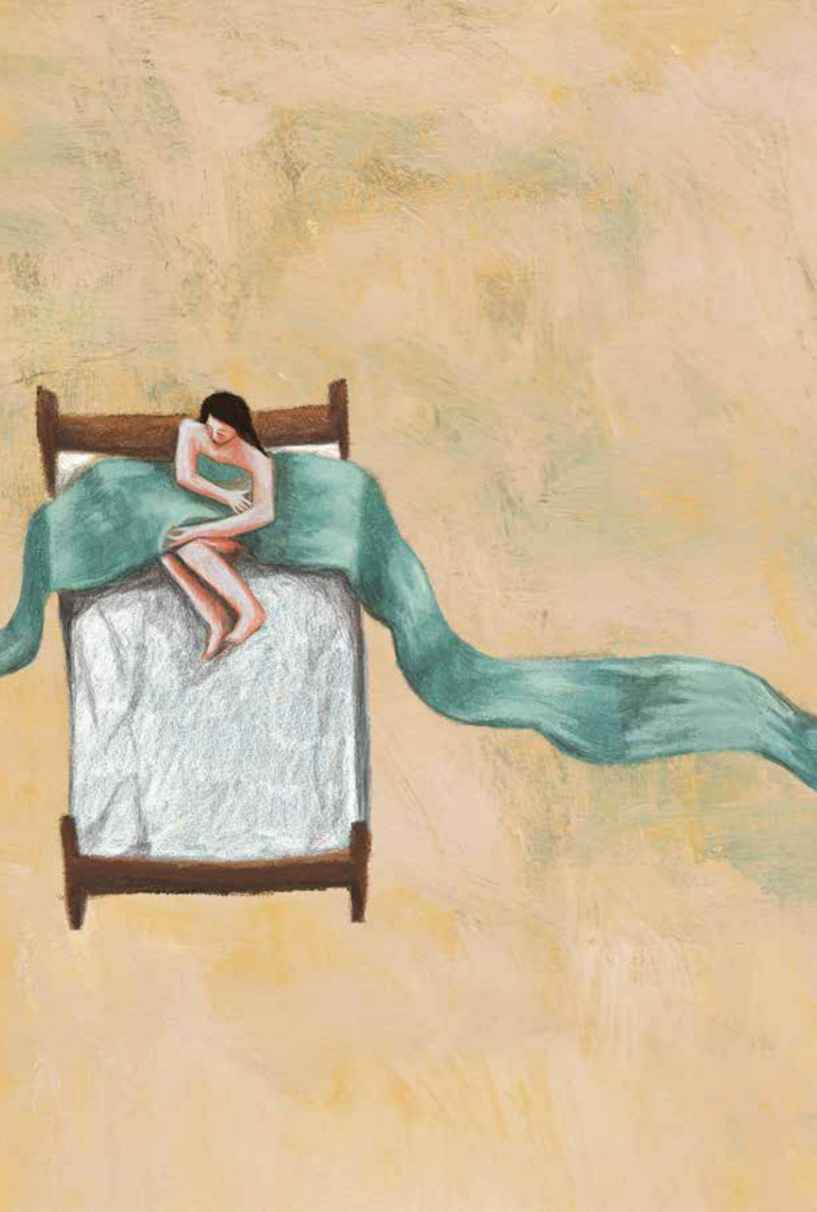
מלון צ'לסי Chelsea Hotel No. 2 (1967)

רק עוד בוקר נשכח במלון מלוכלך ונשאר רק לגמור ולזוז אמרת, תראי איך אנחנו נראים לא יפים, אבל יש לנו מוזיקה